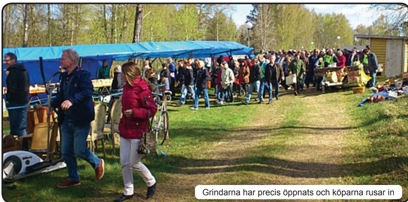
Grindarna har precis öppnats och köparna rusar in

Så inföll då tiden då portarna öppnades och likt ett lämmeltåg, rörde sig horden av köpare mot de överfyllda stånden. De mest erfarna gjorde en snabb översiktsrunda och spanade in de saker som föll mest på läppen och stannade senare upp och startade sitt köpslående.