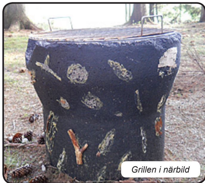
Grillen i närbild