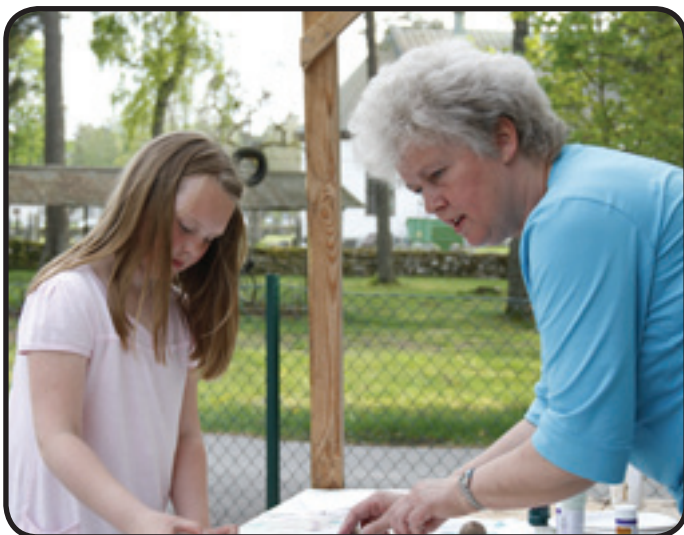
Tilda trycker till potäterna

Hembygdsföreningen slagit läger. Här var det fritt fram att prova på hantverk från svunna tider. Att karda ull och spinna densamma görs väl inte i varje hem nuförtiden. Man kunde också skapa sin egen duk med hjälp av potatistryck. Tänk att förr gjorde man om hemma genom att trycka mönster