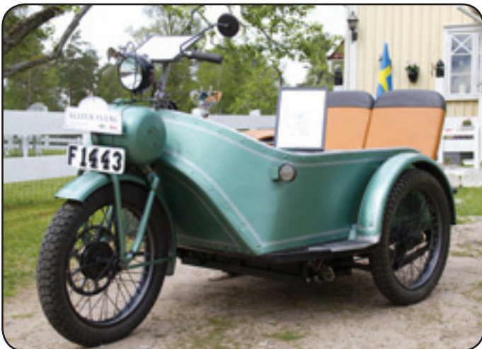
Denna GM elmotorcykel ELC10 från 1942, väckte många intresse

Älvsereds Moppers och Assbergs mopedsällskap var inbjudna och deltog med massor av moppar.