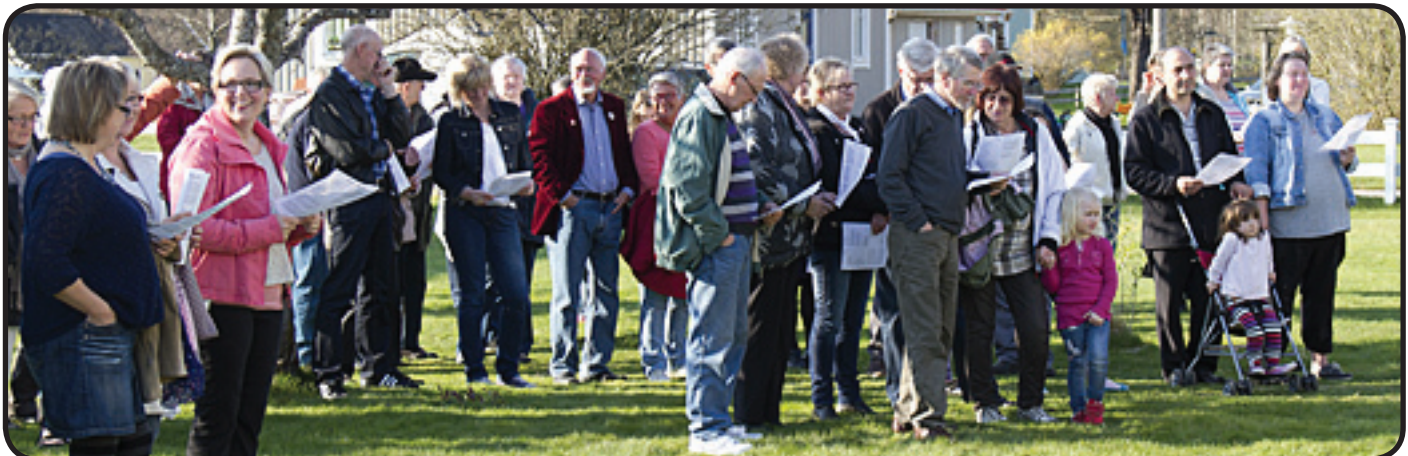
Många slöt upp kring Valborgsmässöfirandet nere vid Församlingshemmet i det vackra vårväddret